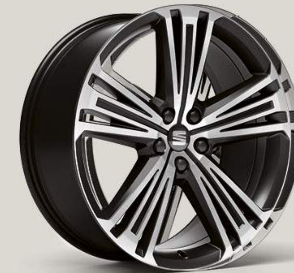
Jantes alliage 20" XE "SUPREME"