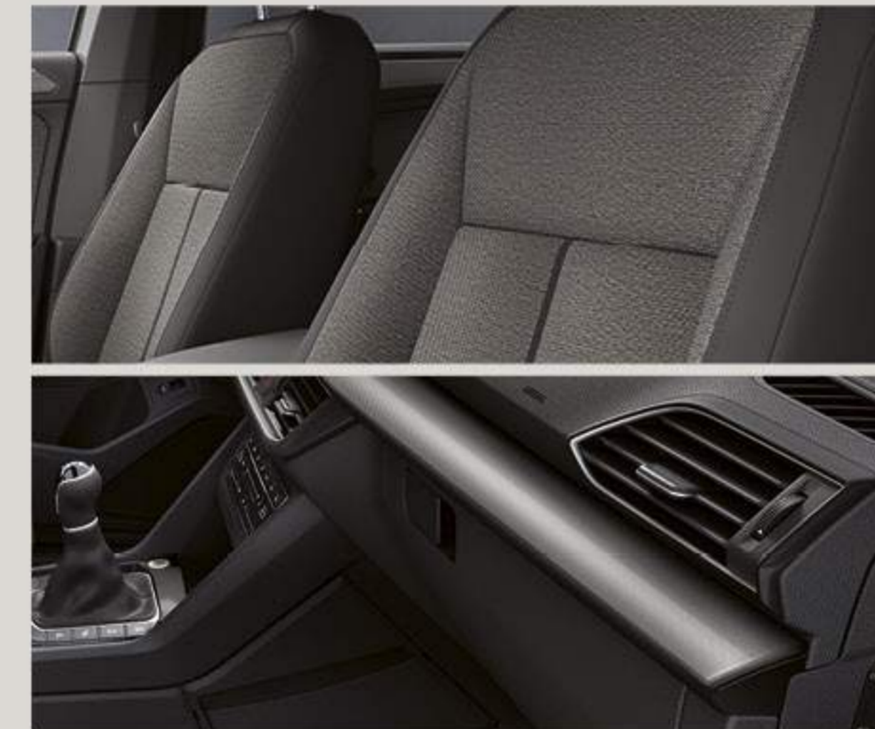
Sellerie tissu gris «Olot» avec inserts noirs Alcantara