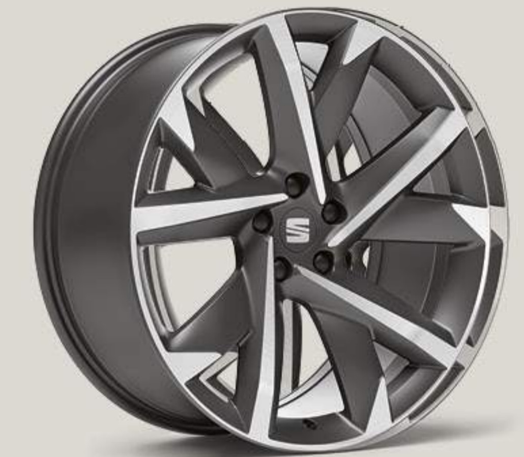
Jantes alliage 20" FR "SUPREME COSMO GREY"