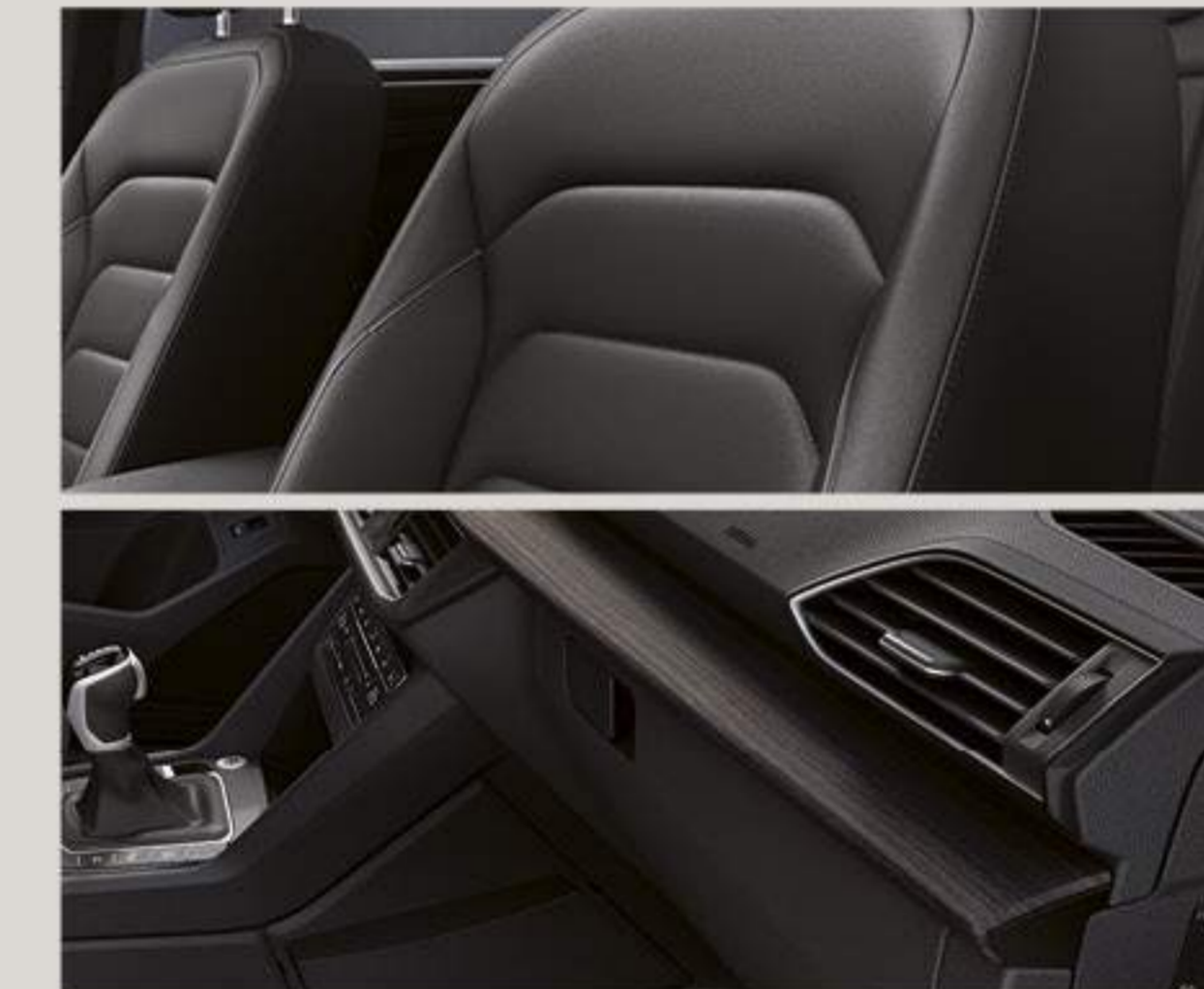
Sellerie cuir noir VIENNA avec Pack Hiver