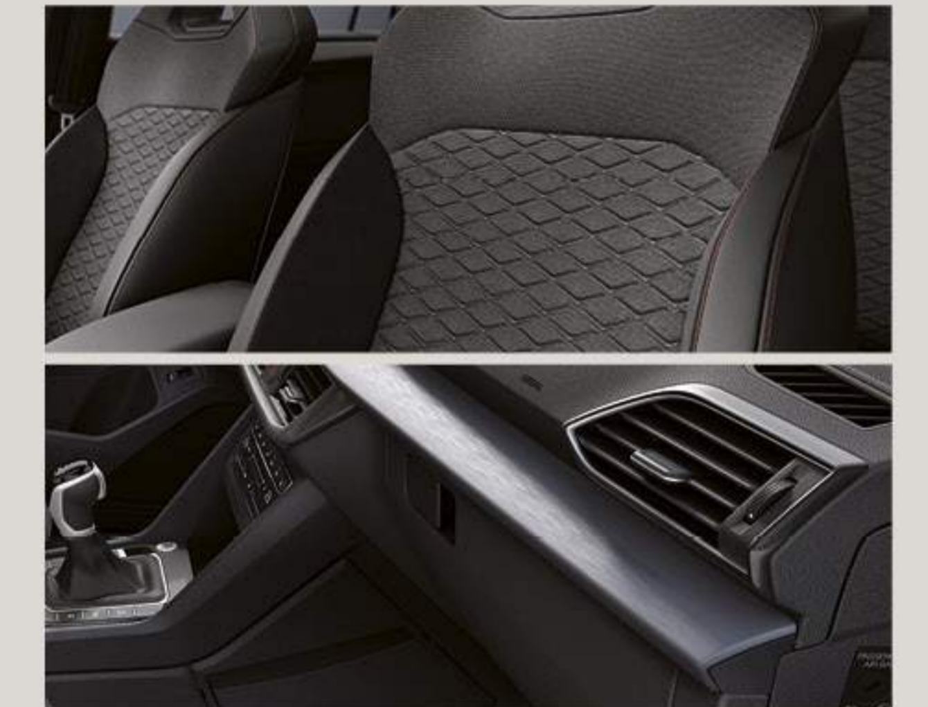
Sellerie tissu gris «Nilo» avec inserts noirs Alcantara