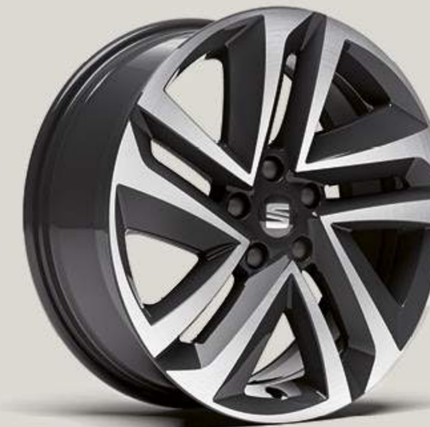
Jantes alliage 18" St "PERFORMANCE"